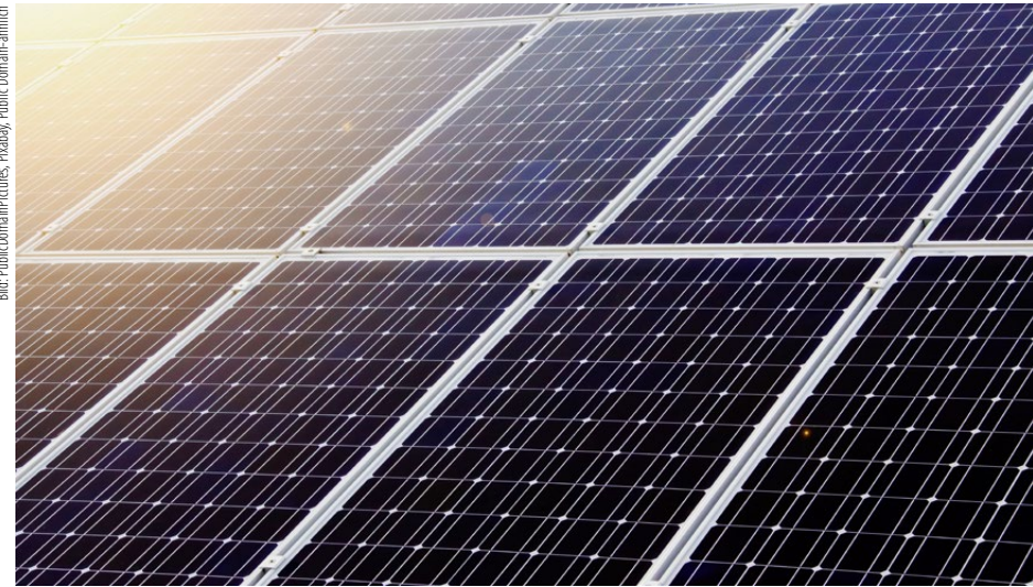
Der Photovoltaik-Zubau in der Schweiz stieg 2020 um mindestens 30 Prozent.

Der Ausbau von Solarstrom ist auf einem Rekordhoch. Er fiel 2020 gegenüber dem Vorjahr um 30 bis 39 Prozent höher aus. Dieser jährliche Zubau soll in den nächsten Jahren um den Faktor drei bis