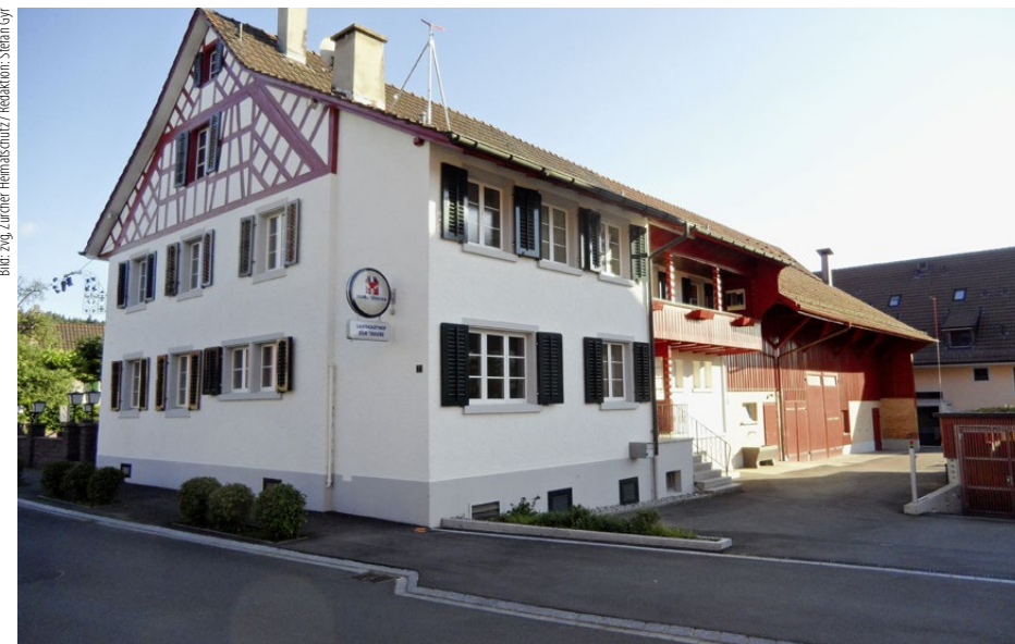
Die «Traube» in Dägerlen ist ein typisches traditionelles Gasthaus aus dem frühen 19. Jahrhundert.

In das Inventar sollen nicht nur Objekte aufgenommen werden, die mit Sicherheit geschützt werden müssten. Es genüge schon «die Möglichkeit, dass sich ein Objekt bei genauerer Untersuchung als schutzwürdiges Denkmal erweisen könnte». Der Fall der «Traube» geht nun zurück an das Zürcher Baurekursgericht. Dieses muss nun über die Schutzwürdigkeit des alten Hauses entscheiden. Bis auf Weiteres bleibt die «Traube» also stehen, und die Wohnungen werden nicht gebaut. (sda/bb)