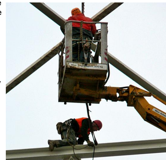
2: Alternative zu Bild 1: Zugang mittels Hubarbeitsbühne