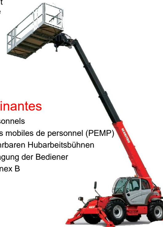
4 Engin multifonction doté d'une nacelle pivotante et de portes d'accès adéquates.

Une force de choc sur la nacelle doit être exclue car elle peut entraîner le renversement de l'engin.