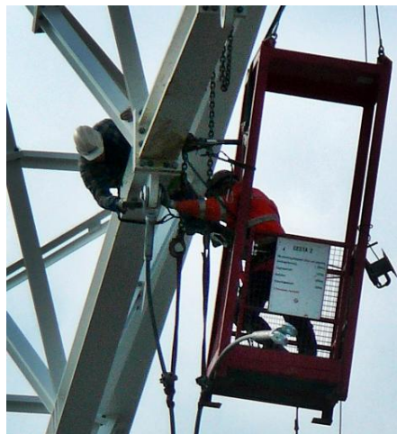
3 Travail d'équipe pour le montage d'une construction métallique complexe

D-A-CH-S est un groupe de travail international réunissant des experts d'Allemagne, d'Autriche, de Suisse et du Tyrol du Sud, chargé d'obtenir à l'échelle de ces pays une unification des réglementations en matière de dispositifs antichute pour les travaux en hauteur.